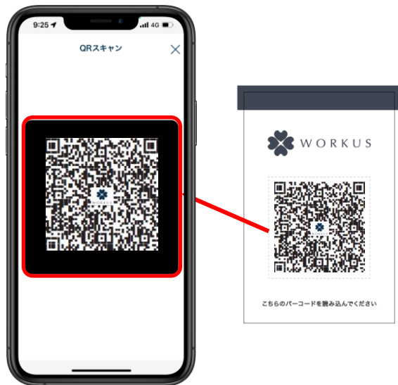
拠点設置のQRポップを「QRスキャン」画面で読み取る

QRスキャン画面に遷移し、アプリのカメラで拠点設置のQRポップのQRを読み取ってください。