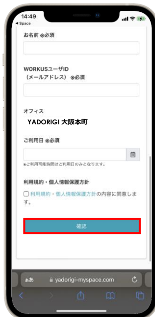
各項目記入の上「確認」ボタンを押下します。