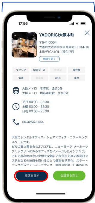
通常通りの座席予約