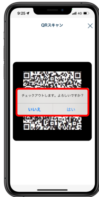
チェックアウト確認

「チェックアウトします。よろしいですか?」と表示されます。チェックアウトする場合、「はい」をタップします。