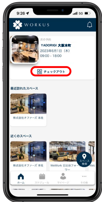
予約カードを確認

予約カードの「チェックアウト」をタップします。 (※予約カードは直近予約分のみ表示されます。)