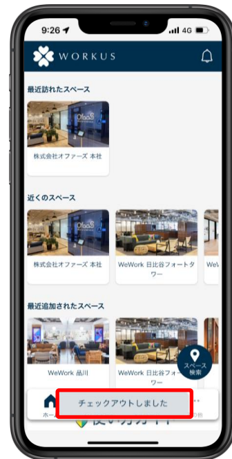
チェックアウト完了

「チェックアウトします。よろしいですか?」と表示されます。チェックアウトする場合、「はい」をタップします。